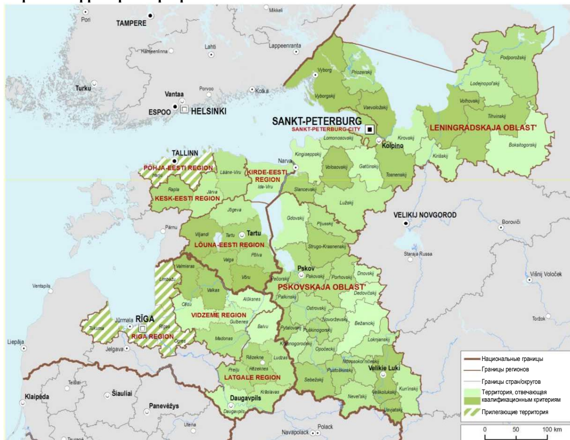
Карта 1. Территория Программы

Описание различных секторов в нижеследующих подразделах охватывает всю территорию Программы, включая соответствующие области и прилегающие территории.